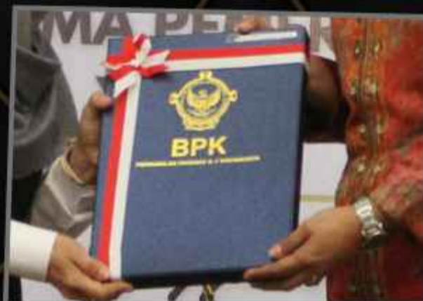
Kepala Perwakilan bersama Para Pimpinan Entitas Penerima LHP dalam acara penyerahan LHP Kinerja dan Kepatuhan Semester II Tahun 2024

Sebagai penutup tahun 2024, BPK Perwakilan Provinsi Daerah Istimewa Yogyakarta (DIY) telah melaksanakan salah satu agenda pentingnya, yakni penyerahan Laporan Hasil Pemeriksaan (LHP) Kinerja dan LHP Kepatuhan kepada para pemangku kepentingan di wilayah DIY. Acara yang berlangsung pada Senin, 23 Desember 2024, di Auditorium Kantor BPK DIY ini menjadi momen refleksi atas capaian pemeriksaan sepanjang tahun.