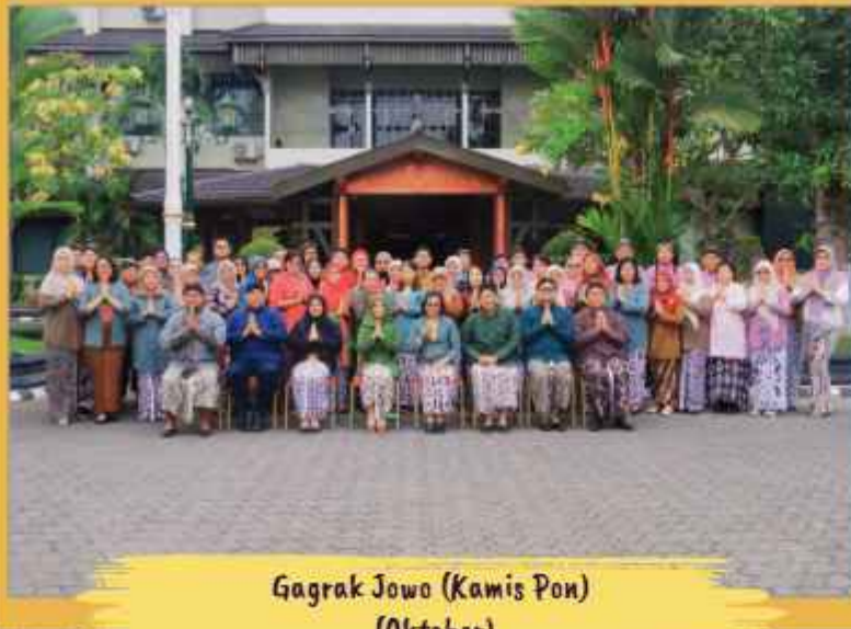
Gagrak Jowo (Kamis Pon) (Oktober)