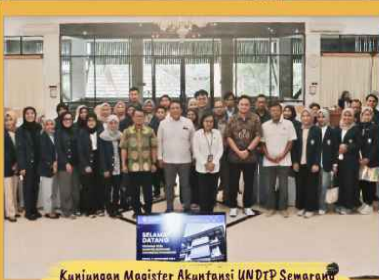
Kunjungan Magister Akuntansi UNDIP Semarang (November)