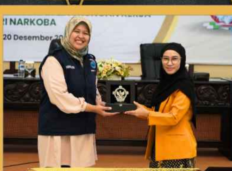
Sosialisasi Pencegahan Narkoba dengan BNN Provinsi DIY (Desember)