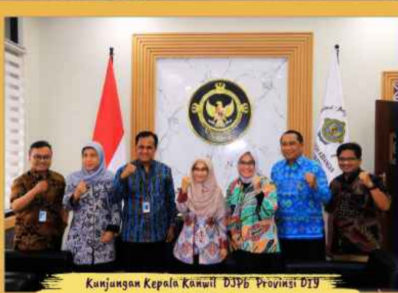
Kunjungan Kepala Kanwil DJPb Provinsi DIY (November)