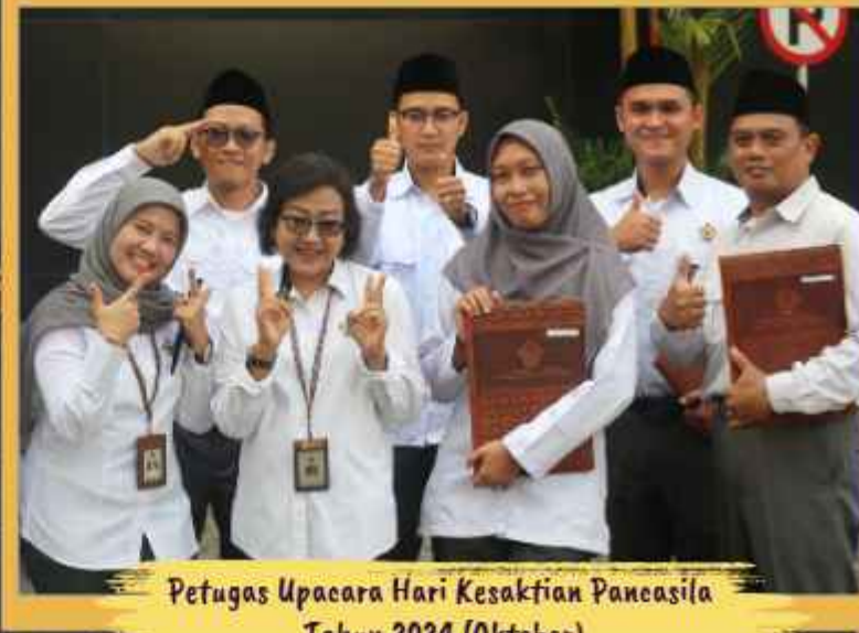
Petugas Upacara Hari Kesaktian Pancasila Tahun 2024 (Oktober)