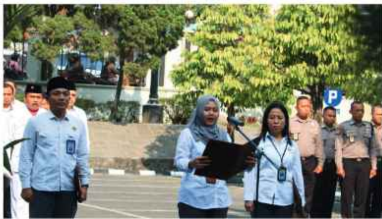
Pelaksanaan Upacara Hari Pahlawan