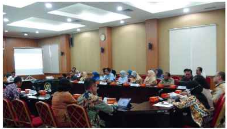
Pertemuan dengan DPD RI