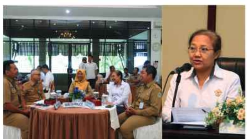
Koordinasi Pemantauan Tindak Lanjut Rekomendasi Hasil Pemeriksaan Tahun 2023