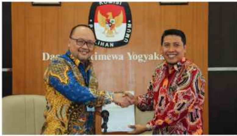
Exit Meeting Pemeriksaan Terinci Kinerja atas Efektivitas Persiapan Penyelenggaraan Pemilihan Umum Tahun 2024 pada Komisi Pemilihan Umum DIY