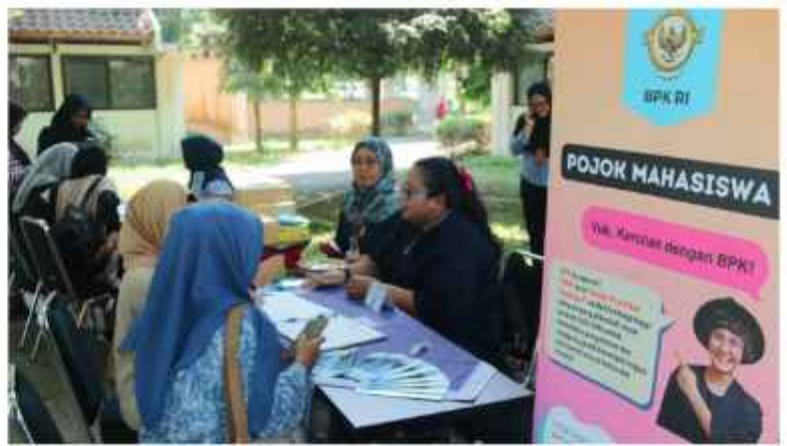
Kegiatan Pojok Mahasiswa di Kampus UMY