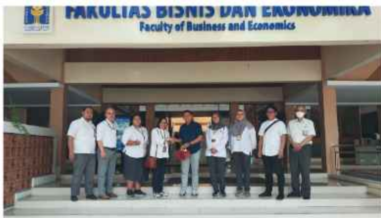
Penyerahan Cendera Mata Acara Pojok Mahasiswa di Kampus Fakultas Ekonomi UII