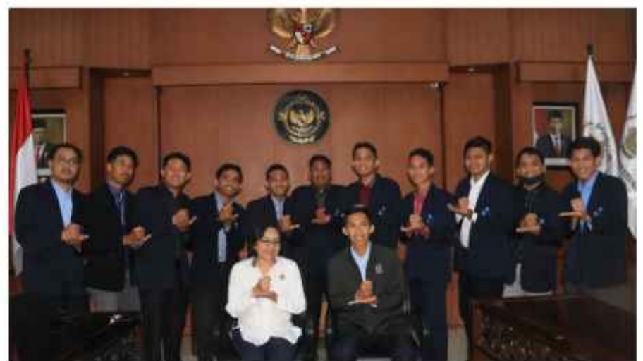
Kunjungan Studi University of Darussalam Gontor, Ponorogo