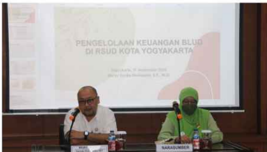
Kepala Perwakilan Membuka FGD Pengelolaan Keuangan BLUD di RSUD Kota Yogyakarta