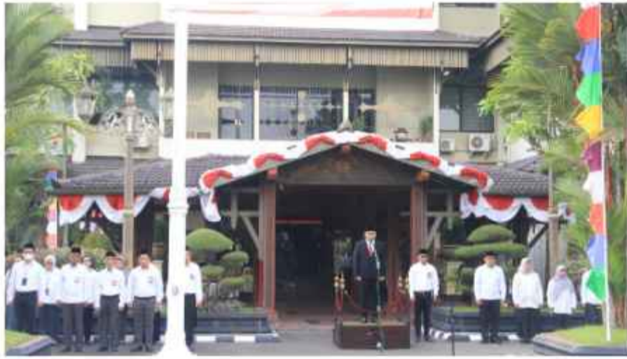
Upacara Peringatan HUT ke-78 Kemerdekaan RI