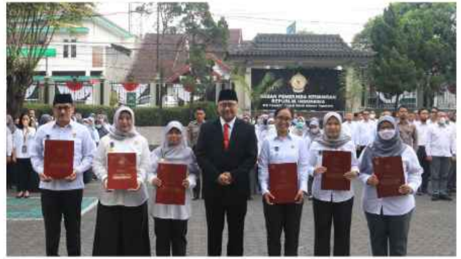
Penganugerahan Satya Lencana Karya Satya