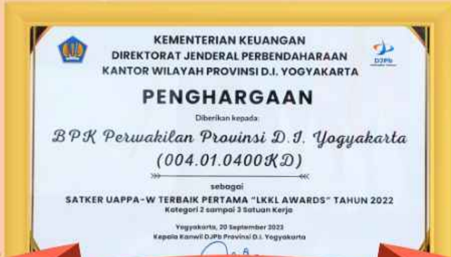
Piagam Penghargaan sebagai Satker UAPPA-W Terbaik Pertama "LKKL AWARDS" Tahun 2022