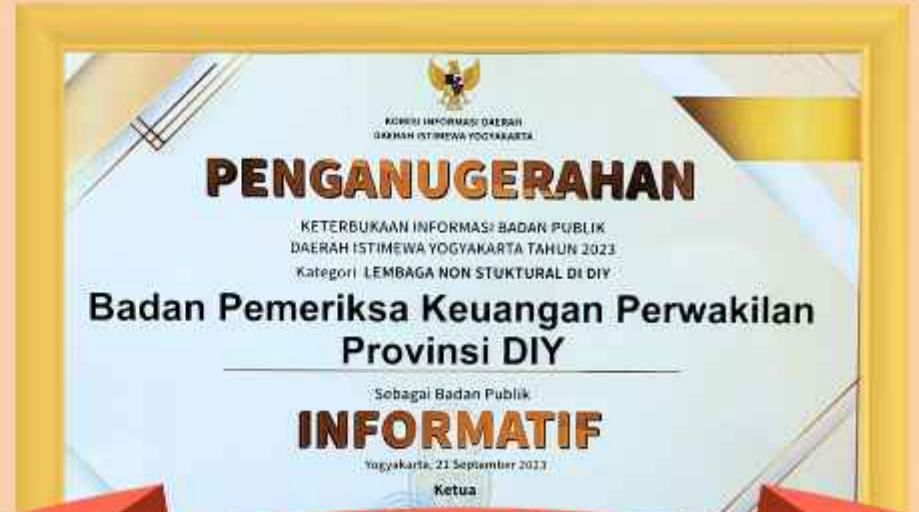
Piagam Penghargaan BPK DIY sebagai Badan Publik Informatif Tahun 2023